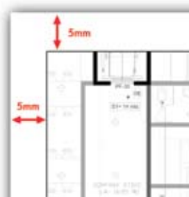
Margens de 5 mm