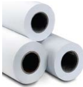
Rolos de mídia longos HP